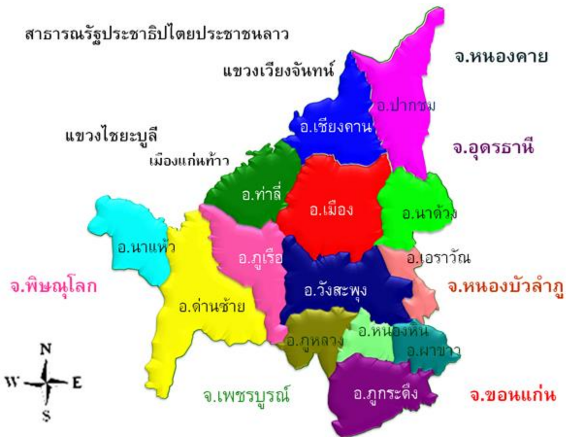
ภาพประกอบที่ 1 แผนที่จังหวัดเลย